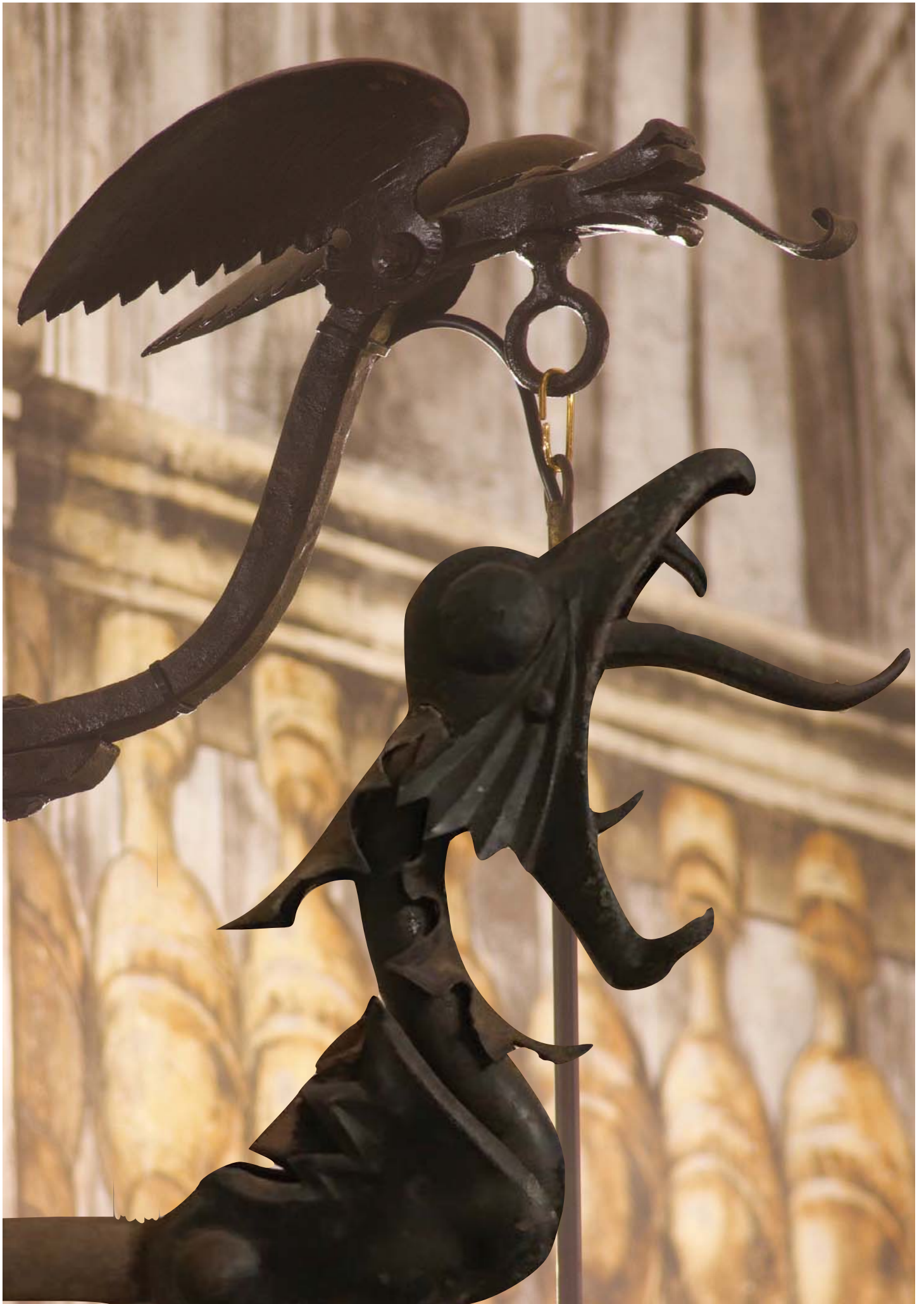
Dracs de forja. Capella dels Dolors i Casa Coll i Regàs (Mataró).